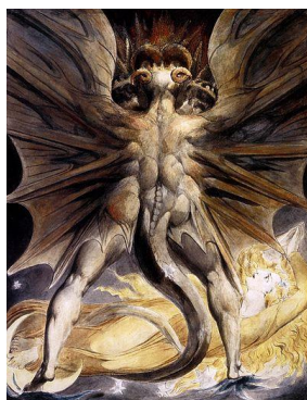
William Blake The Great Red Dragon and the Woman Clothed in Sun c. 1803-1805