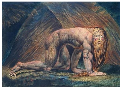
William Blake Nebuchadnezzar a. 1795