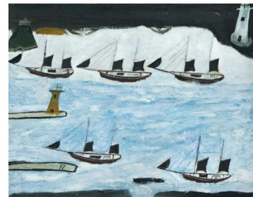
Alfred Wallis Five Ships Mount's Bay c. 1928