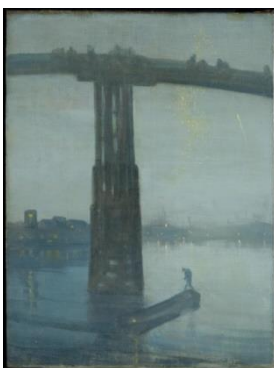
James Whistler Nocturne: Blue and Gold c. 1872-5