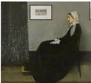
James McNeill Whistler Whistler's Mother a. 1871